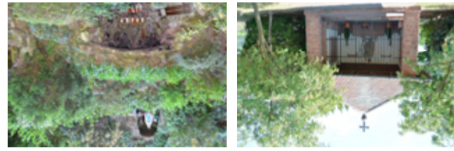
Wanderungen und Spaziergänge

An die Retter der Kirchenglocken vor dem Zugriff der französischen Revolutionsheere im Jahr 1794 erinnert der Glockenbrunnen am Ortsrand zum Modenbachtal. Von diesem Ausgangspunkt für Wanderungen ist es nicht weit zur Michaelskapelle , die 1951 zum Gedenken an die Opfer der beiden Weltkriege errichtet wurde und Namensgeber für die Weinlage „Michelsberg“ ist. Hier bietet sich ein herrlicher Rundumblick in die Rheinebene. Am Waldrand wurde 1904 die Loudeggrotte angelegt.