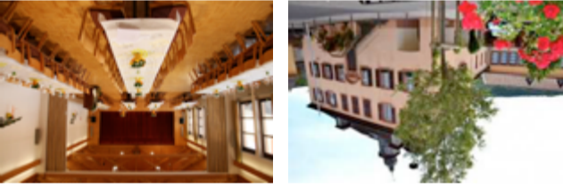
Dorfgeschäftshaus und alter Schulhof

Aus dem 18. Jahrhundert stammt das ehemalige fürstbischöfliche Zehnhaus, das 1872 von der Gemeinde erworben und jahrzehntelang als Schul- und Gemeindehaus genutzt wurde. Die Schulhausweiterung aus den 1950er-Jahren wurde nach Auflösung der Dorfgeschäftshaus umgebaut. Der abtrennbare Saal bietet bis zu 180 Personen Platz für Konzerte, Theateraufführungen, Ausstellungen oder Familienfeiern. Ein Konferenzraum bietet für bis zu 30 Personen Platz im 2014 sanierten denkmalgeschützten Teil. Daneben steht es auch den Vereinen für Sport und Musikproben offen und beherbergt im Untergeschoss den Geräteraum der freiwilligen Feuerwehr.