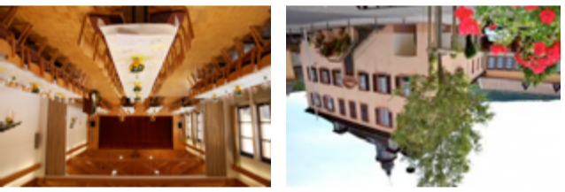
Dorfgeschäftshaus und alter Schulhof

Aus dem 18. Jahrhundert stammt das ehemalige fürstbischöfliche Zehnhaus, das 1872 von der Gemeinde erworben und jahrzehntelang als Schul- und Gemeindehaus genutzt wurde. Die Schulhausweiterung aus den 1950er-Jahren wurde nach Auflösung der Dorfgeschäftshaus zum ungenutzten Saal bietet bis zu 180 Personen Platz für Konzerte, Theateraufführungen, Ausstellungen oder Familienfeiern. Ein Konferenzraum bietet für bis zu 30 Personen Platz im 2014 sanierten denkmalgeschützten Teil. Daneben steht es auch den Vereinen für Sport und Musikproben offen und beherbergt im Untergeschoss den Geräteraum der freiwilligen Feuerwehr.