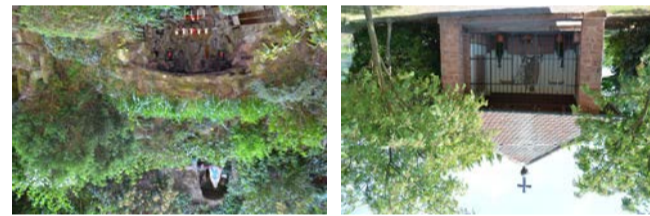
Wanderungen und Spaziergänge

An die Retter der Kirchenglocken vor dem Zugriff der französischen Revolutionsheere im Jahr 1794 erinnert der Glockenbrunnen am Ortsrand zum Mosenbachtal. Von diesem Ausgangspunkt für Wanderungen ist es nicht weit zur Michaelskapelle , die 1951 zum Gedenken an die Opfer der beiden Weltkriege errichtet wurde und Namensgeber für die Weinlage „Michelsberg“ ist. Hier bietet sich ein herrlicher Rundumblick in die Rheinebene. Am Waldrand wurde 1904 die Loudeggrotte angelegt.