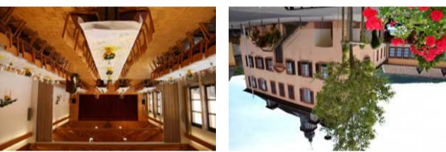
Dorfgemeinschaftshaus und alter Schulhof

Aus dem 18. Jahrhundert stammt das ehemalige fürstbischöfliche Zehnthaus, das 1872 von der Gemeinde erworben und jahrzehntlang als Schul- und Gemeindegarten genutzt wurde. Die Schulhausenerweiterung aus den 1950er-Jahren wurde nach Auflösung der Dorfschule zum Dorfgemeinschaftshaus umgebaut. Der abtrennbare Saal bietet bis zu 180 Personen Platz für Konzerte, Theateraufführungen, Ausstellungen oder Familienfeiern. Ein Konferenzraum bietet für bis zu 30 Personen Platz im 2014 sanierten denkmalgeschützten Teil. Daneben steht es auch den Vereinen für Sport und Musikproben offen und beherbergt im Untergeschoß den Geräteraum der freiwilligen Feuerwehr.